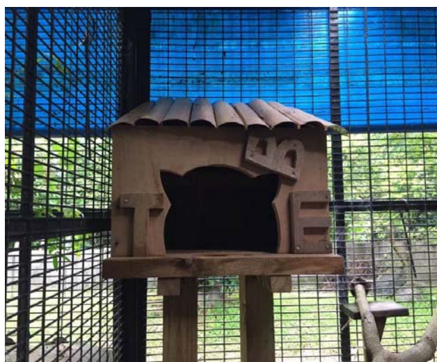
石虎休憩空間更新-小木屋增設