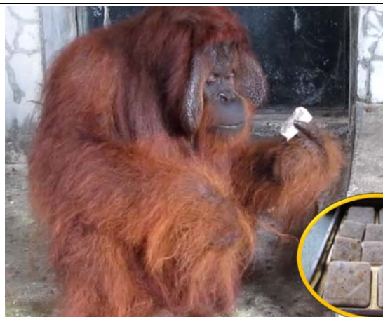
紅毛猩猩品嘗中秋月餅冰