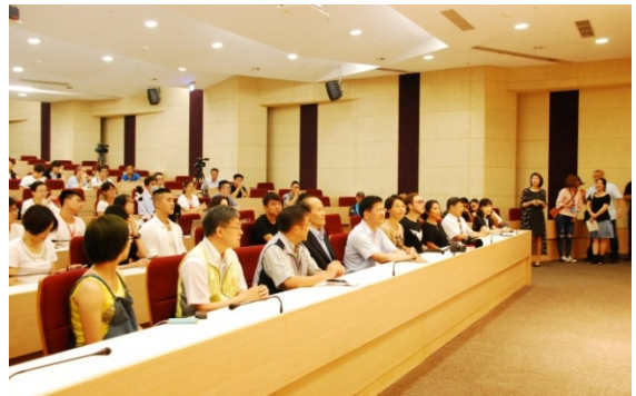
2017 挺挺動物聯合展『白熊計劃 x WILD-LIFE』記者會