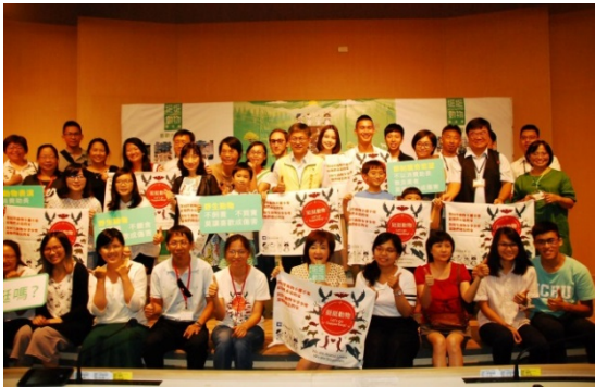
2017 挺挺動物聯合展『白熊計劃 x WILD-LIFE』記者會後大合照

透過攝影展方式，讓更多人知道野生動物在圈養環境下的無奈。人類在有意識或無意識的情況下消費野生動物，這讓野動物被迫離開自己的家，喪失了自由，甚至飽受折磨和威脅。