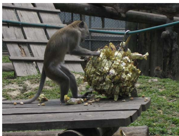
台灣獼猴使用吊在空中的餵食器