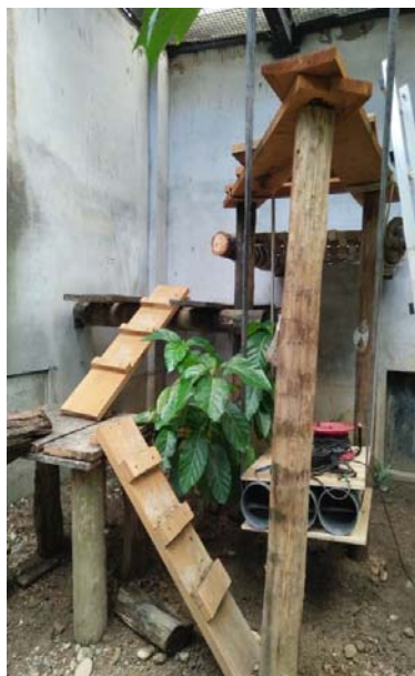
馬來熊籠舍布置更新